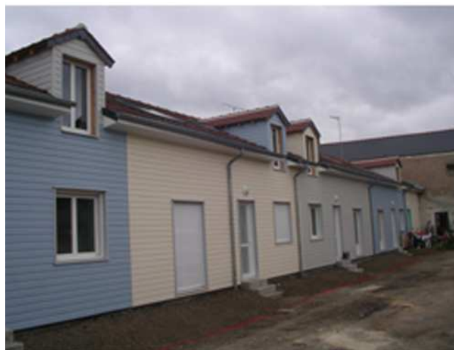
PROJET PENDANT TRAVAUX 1

Cinq logements voués à la location ont été créés à l'emplacement d'un hangar de stockage.