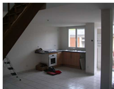
PRISE DE VUE PROJET DE L'INTERIEUR