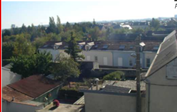
PRISE DE VUE DU PROJET D'ENSEMBLE