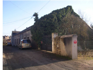
EXISTANT FACADE SUR RUE